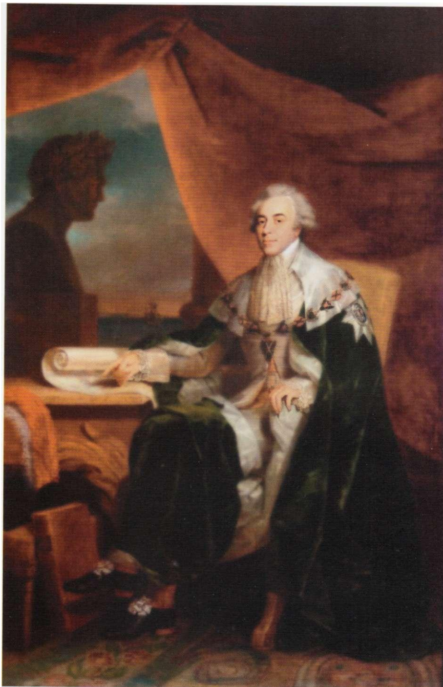
Рис. 1. Н.П. Румянцев (1754-1826). Репродукция с картины Дж. Доу