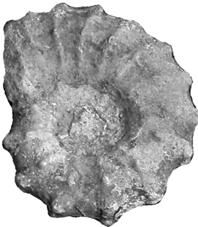
Рис. 5. Kosmoceras sp. Карадаг, Туманова балка, средний келловей, зона coronatum . Сборы 2003 г. Увеличено.